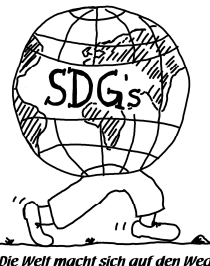
Die Welt macht sich auf den Weg